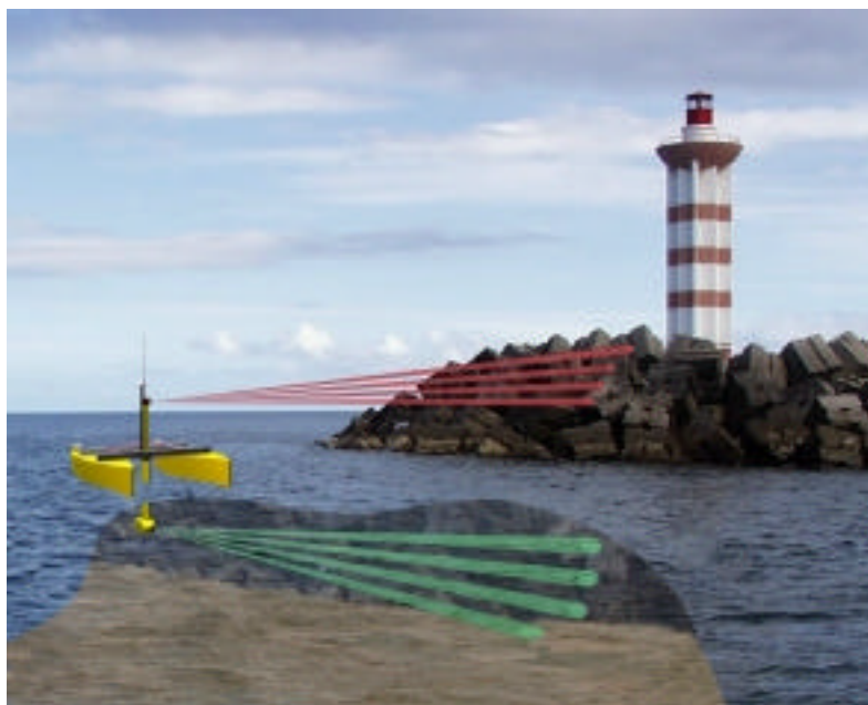
Figura 2: Catamarã a fazer um levantamento

Este veículo está também integrado numa rede de comunicações em tempo real, via rádio, desenvolvida no ISR. Esta rede, especialmente desenhada para aplicações de robótica multi-veículo, utiliza rádios com protocolo TDMA (Time Division Multiple Access) e vai permitir ter acesso em terra aos dados produzidos pelo instrumento. A Figura 2 apresenta o conceito da utilização do catamarã DELFIM para realizar levantamento de quebra-mares. A figura mostra a colocação do instrumento no veículo autónomo bem como a utilização do sistema laser e da sonda acústica ao longo de um possível levantamento de um quebra-mar.