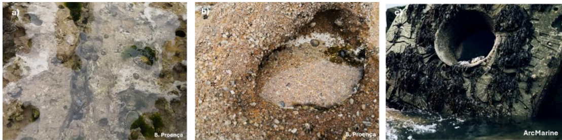
Figura 2. Exemplos de técnicas de eco-engenharia (naturais e artificiais). a) Superfícies texturizadas; b) estruturas de retenção de água e c) estruturas de passagem e refúgio.

2 apresentam-se exemplos de conceitos para a aplicação de técnicas de eco-engenharia.