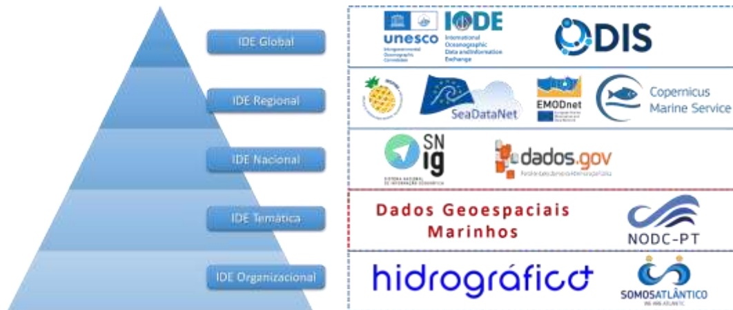
Figura 1. Enquadramento das infraestruturas de dados espaciais em Portugal.

em Portugal, de uma IDE nacional temática especificamente dedicada ao meio marinho, com capacidade para integrar, normalizar e disponibilizar de forma coerente a informação proveniente de diferentes fontes institucionais. Esta lacuna contrasta com o panorama internacional, onde têm sido desenvolvidas iniciativas congêneres no âmbito do programa International Oceanographic Data and Information Exchange (IODE) da Comissão Oceanográfica Intergovernamental (COI) da Organização das Nações Unidas para a Educação, Ciência e Cultura (UNESCO), que promove, entre outros mecanismos, a criação de centros nacionais de dados oceanográficos (COI, 2022; COI, 2023).